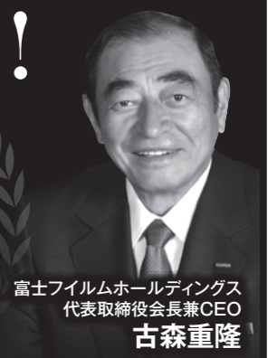
富士フイルムホールディングス 代表取締役会長兼CEO 古森重隆