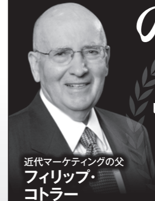
近代マーケティングの父 フィリップ・コトラー